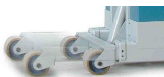
Empattement variable Course 500 mm

Télécommande filaire 4 axes de série avec potentiomètre